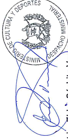
Lic. Elder Súchite Vargas MINISTRO DE CULTURA Y DEPORTES